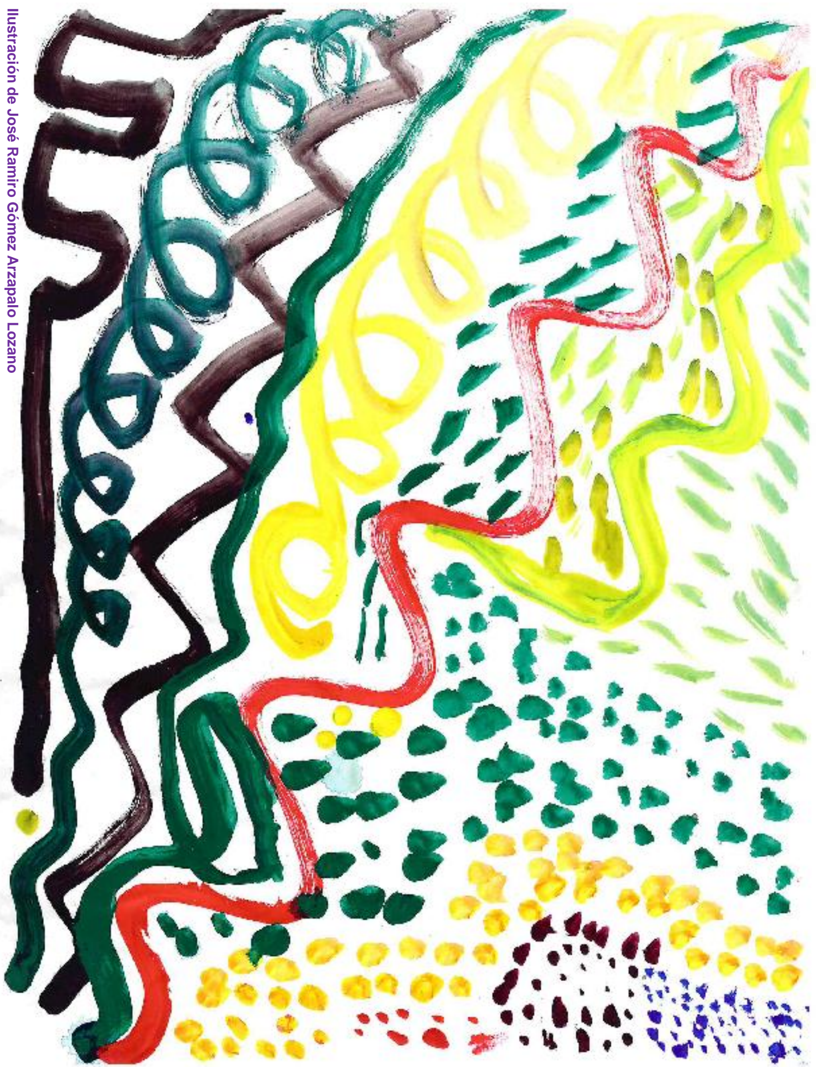
Ilustración de José Ramiro Gómez Arzapalo Lozano