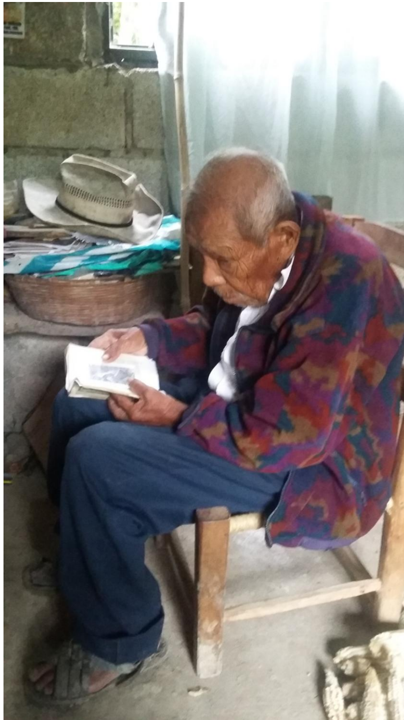
Expo Esp. Rit. Mex-Guate Alicia 12