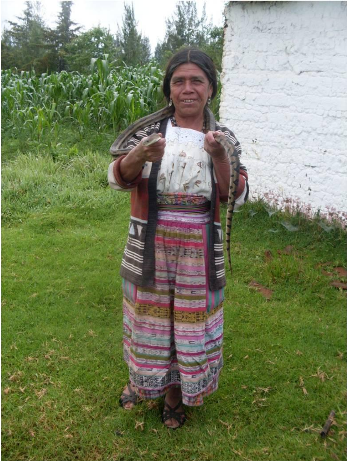
Expo Esp. Rit. Mex-Guate Albo 11