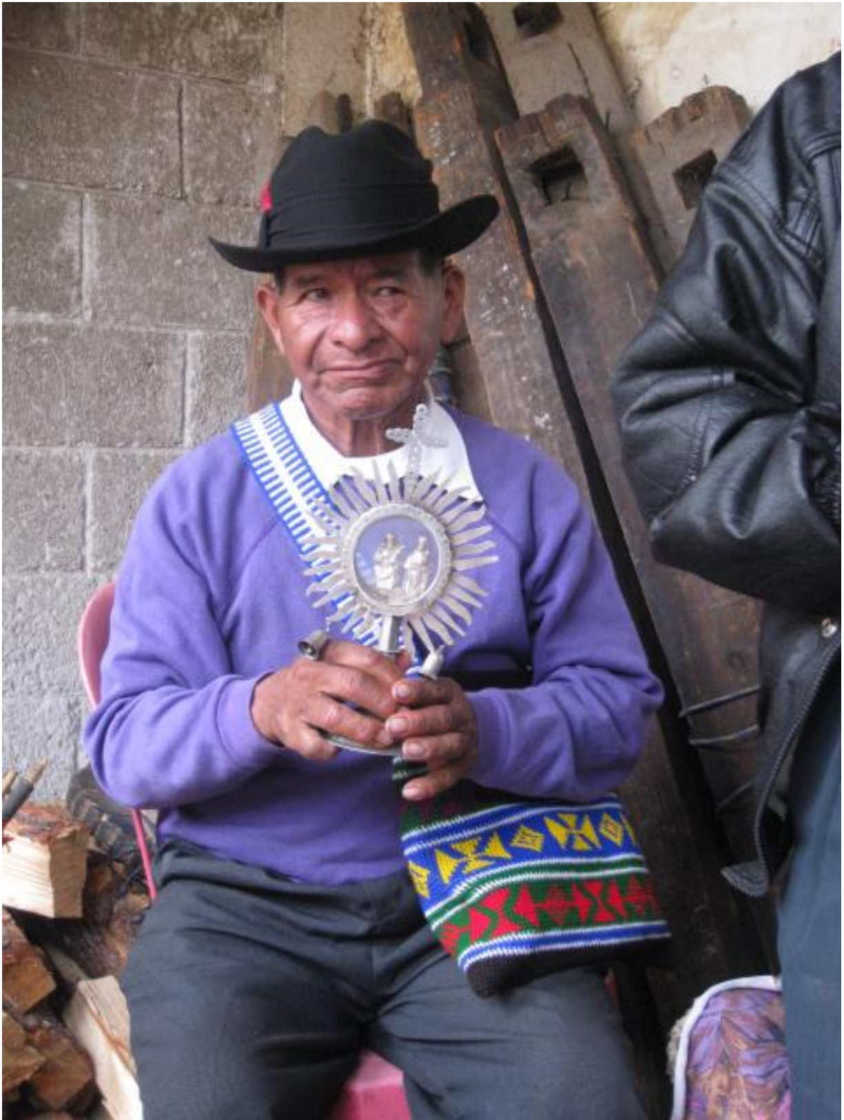
Expo Esp. Rit. Mex-Guate Alba 6