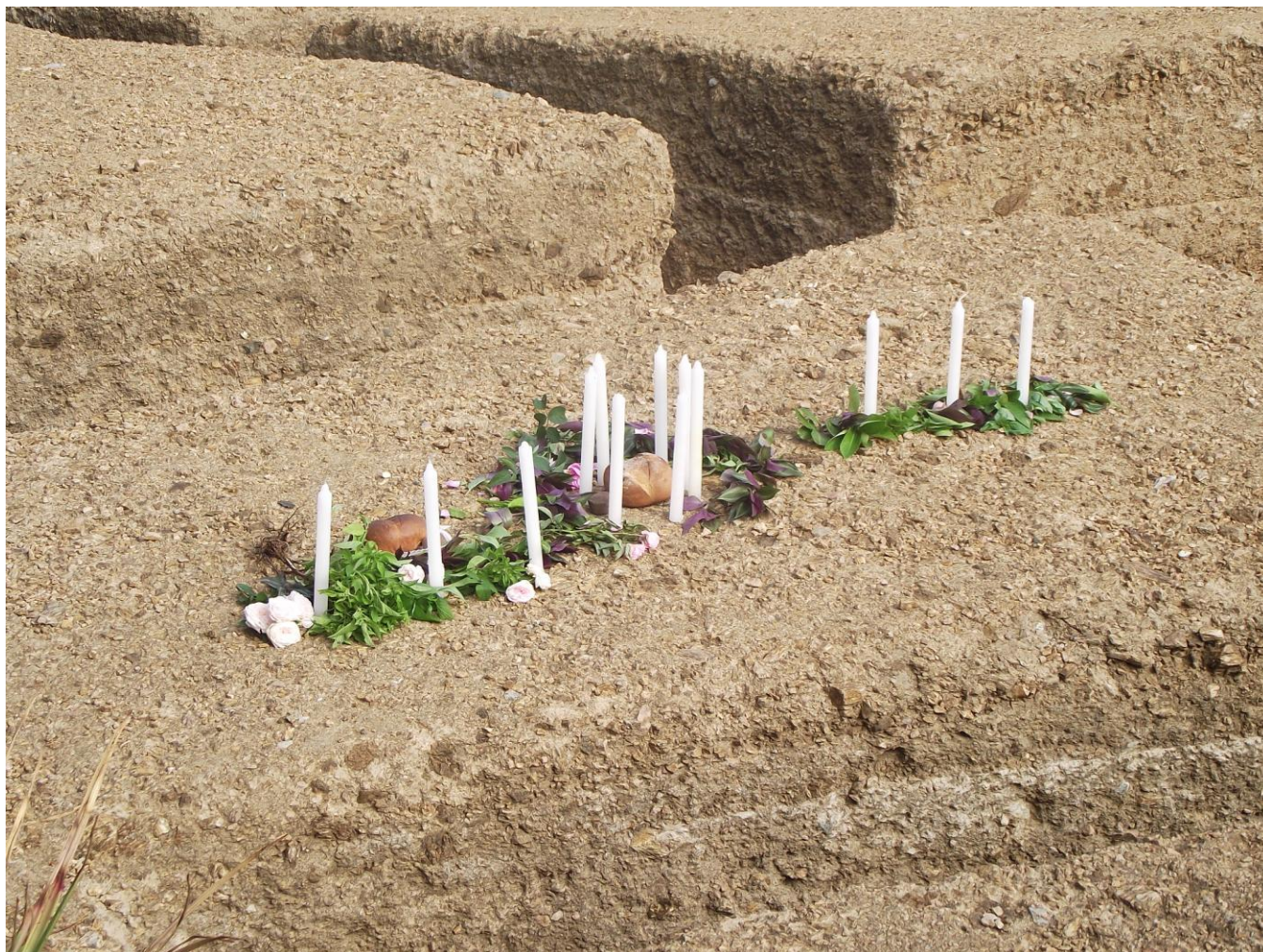
Expo Esp. Rit. Mex-Guate Ramiro 10