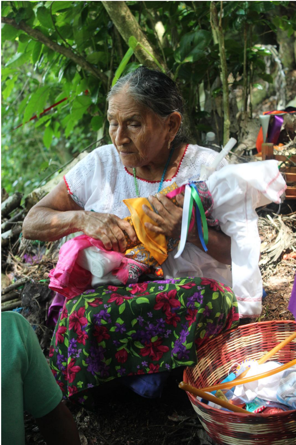
Expo Esp. Rit. Mex-Guate Alicia 13