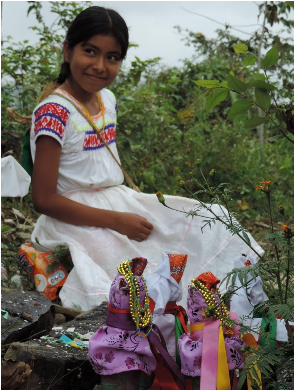
Expo Esp. Rit. Mex-Guate. Alba 12