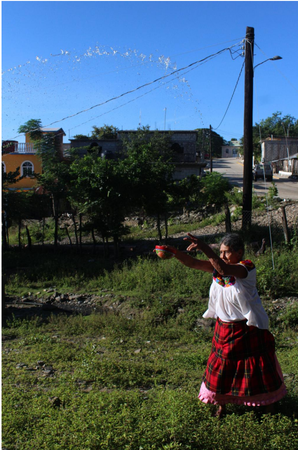
Expo Esp. Rit. Mex-Guate Rafael 4

Lugar: Ixcacuatitla, Chicontepepec, Veracruz. Fecha: julio 2016. Mujer avienta agua hacia donde está su comunidad para que no le falte el vital líquido.