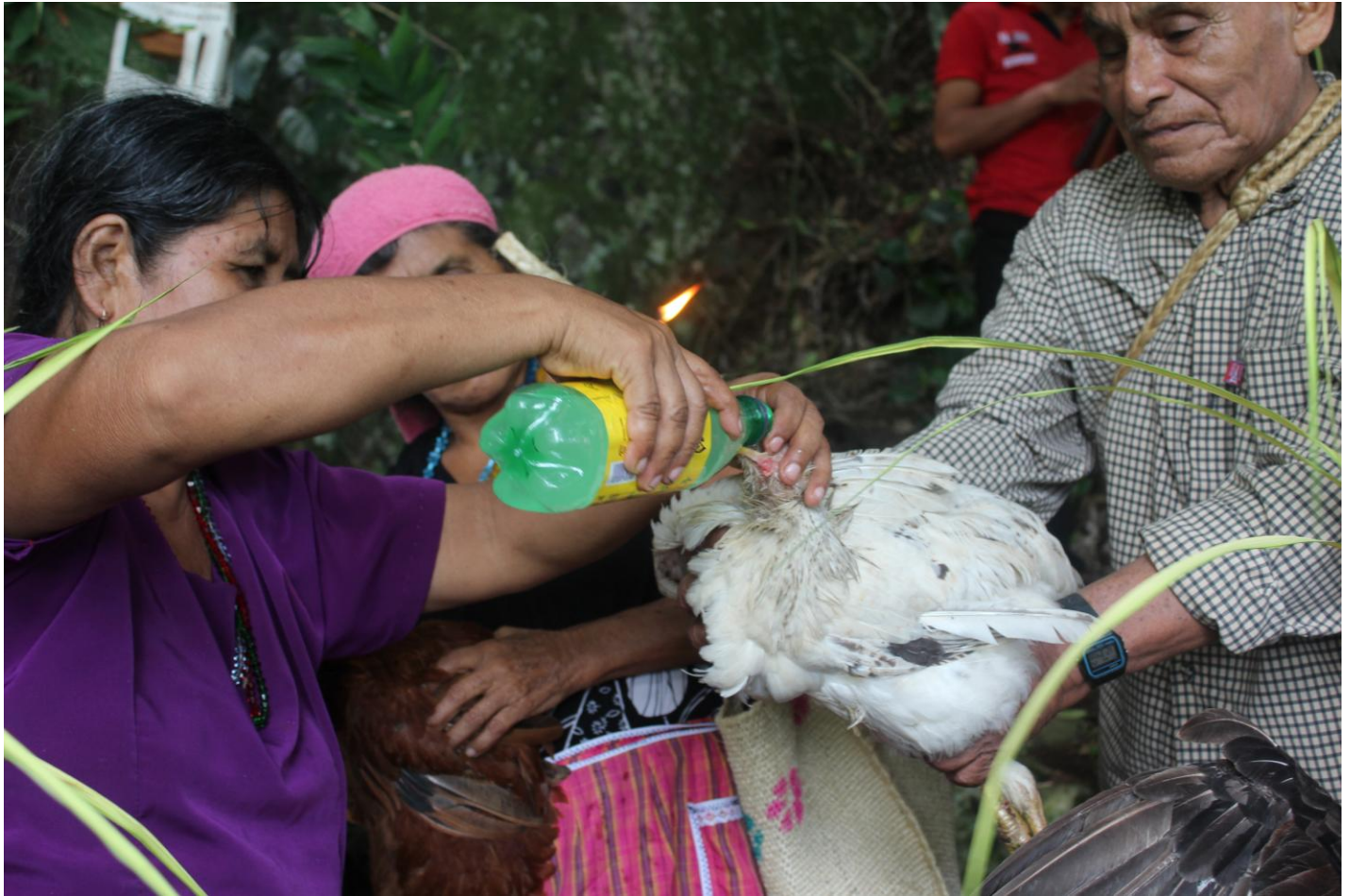
Expo Esp. Rit. Mex-Guate Alicia 16

Lugar: Ixcacuatitla, Chicontepepec, Veracruz.