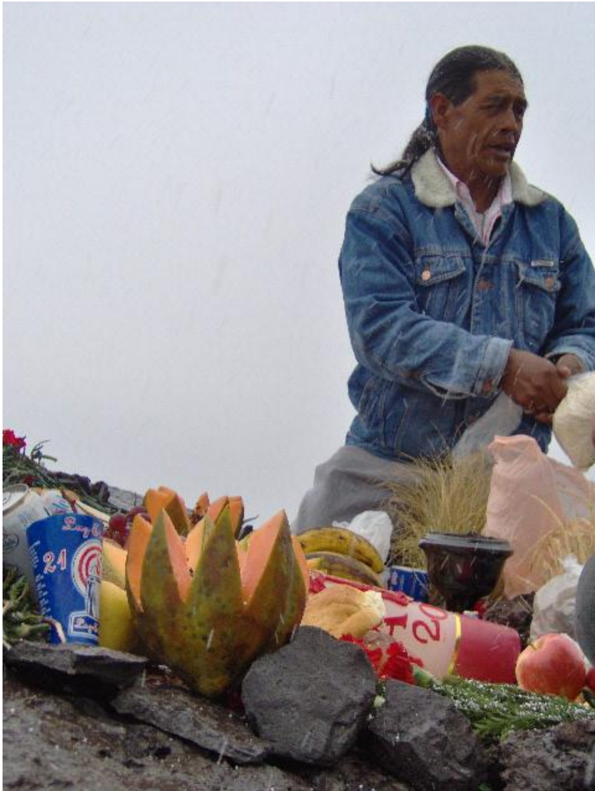
Expo Esp. Rit. Mex-Guate Alicia 11