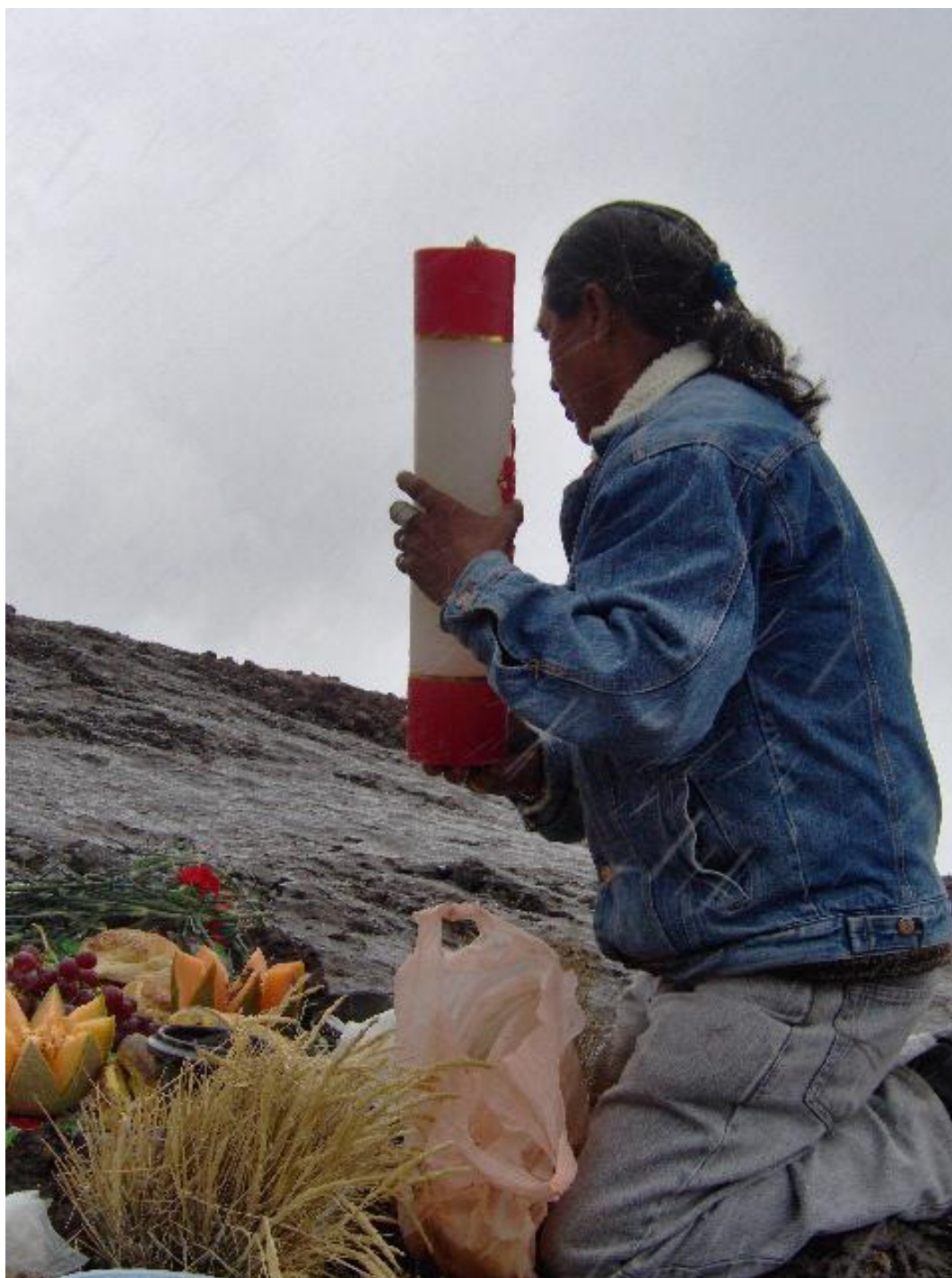
Expo Esp. Rit. Mex-Guate Alicia 10