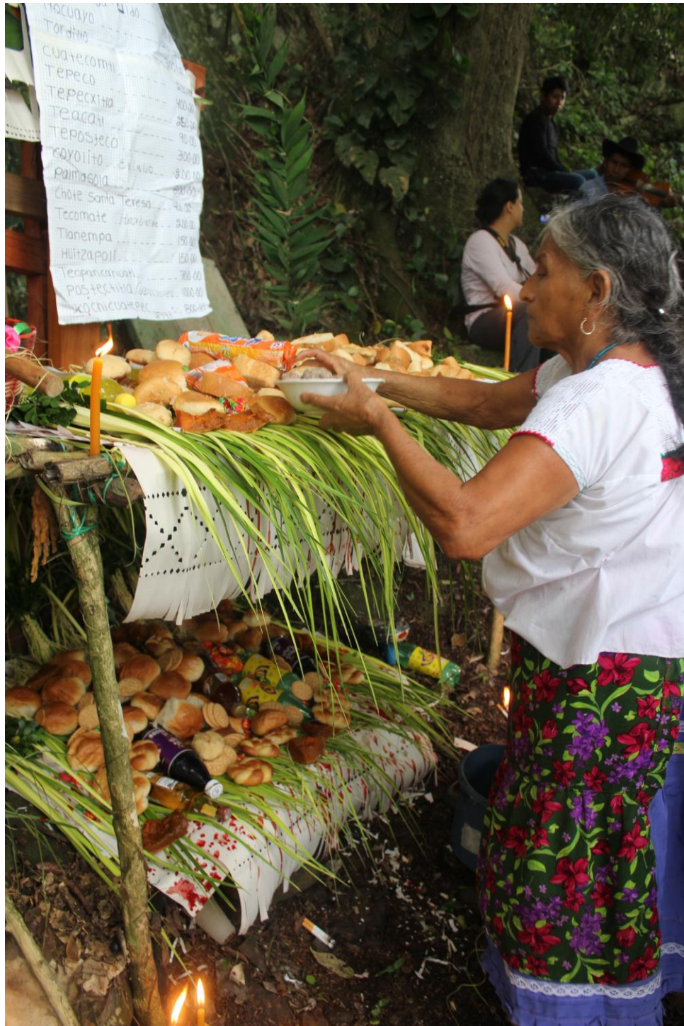
Expo Esp. Rit. Mex-Guate Alicia 18