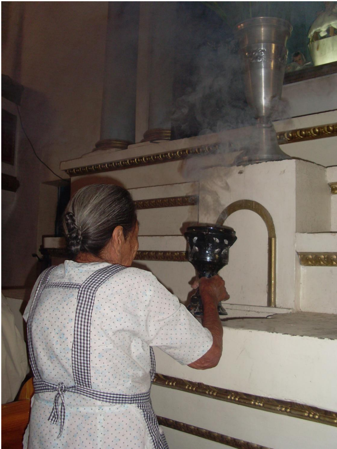
Expo Esp. Rit. Mex-Guate Alicia 4

Doña Jovita enciende el sahumero para recibir a las personas que han ido a dejar las ofrendas en los lugares sagrados. San Andrés de la Cal, Morelos. Autor: A. Juárez, 2008.