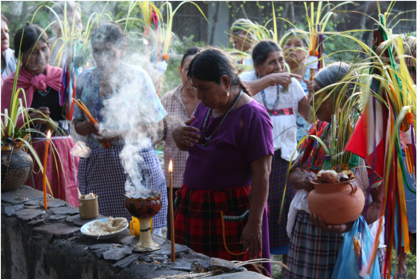
Expo Esp. Rit. Mex-Guate Rafael 1

Lugar: Ixcacuatitla, Chicontepec, Veracruz.