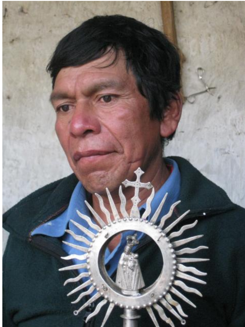
Expo Esp. Rit. Mex-Guate Alba 5