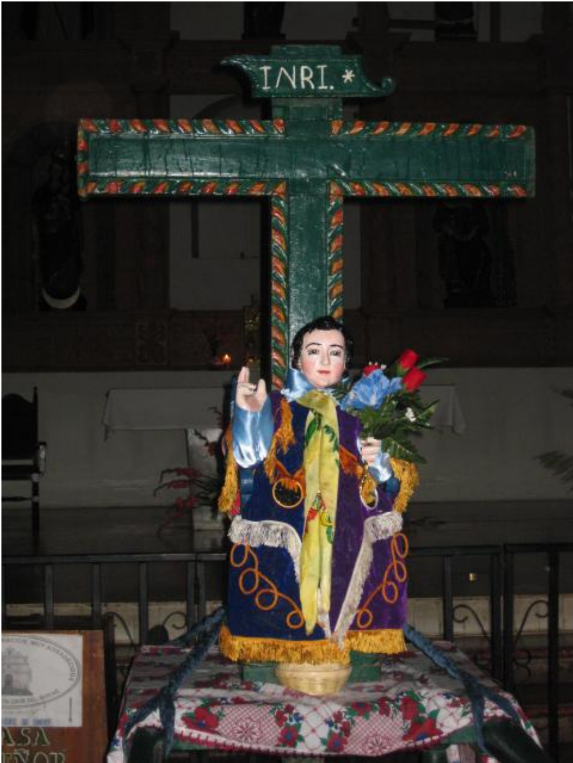
Expo Esp. Rit. Mex-Guate Alba 1